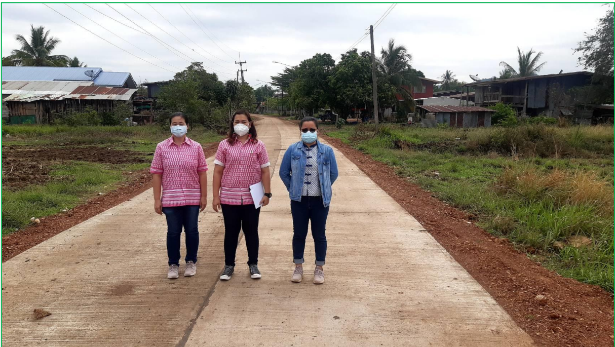
หลังดำเนินการ