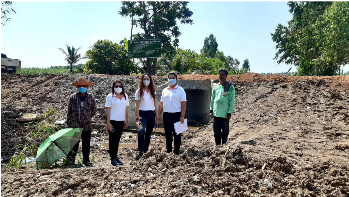
หลังดำเนินการ